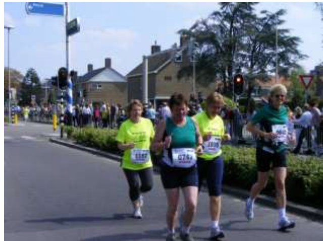
Drie van de vier loopmaatjes hadden er toen nog lol in.

Want het ontbreekt ook aan tijd om vele wedstrijdjes af te lopen. Steevast is het op zondagochtend lopen met zijn vieren, als een ieder kan, ergens in een mooie natuurgebied, rondom het Dwingelderveld bijvoorbeeld. Ciska liep ook wel eens mee, maar gaf de voorkeur aan het zondagochtend familiegevoel.